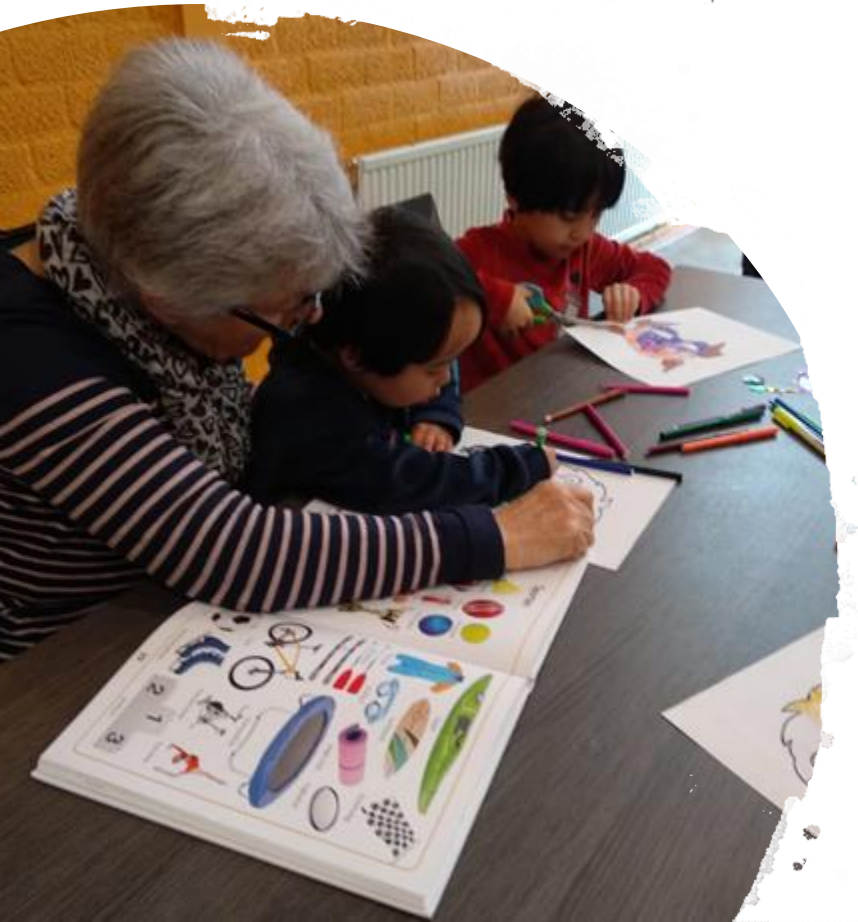
MOP(Mama – Oma Project) (foto's van de Pilot in Hilversum)